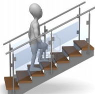
Escaliers 1er étage